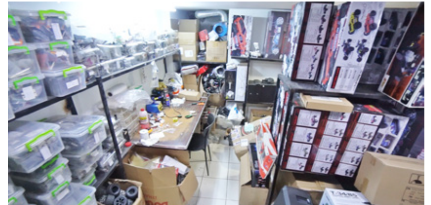
Tahtakale'deki dükkanın alt katında Atmaca kardeşler; hem fotokopi kağıtlarının ticaretini gerçekleştiriyor, hem de bu alanı bir mutfak gibi kullanıyorlardı.