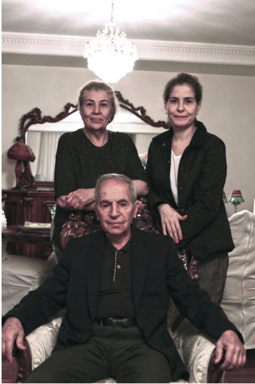
Atmaca ve Tekel ailesi; bir gün şehir değiştirip ayrılmak zorunda dahi kalsalar görüşmekten ve 'bir' olmaktan asla vazgeçemediler... Yıllar onları asla ayıramadı...