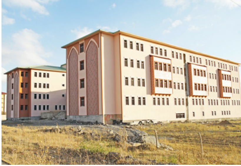
Hayrettin Atmaca Kız İmam Hatip Lisesi'nin bu yıl içerisinde açılması planlanıyor.