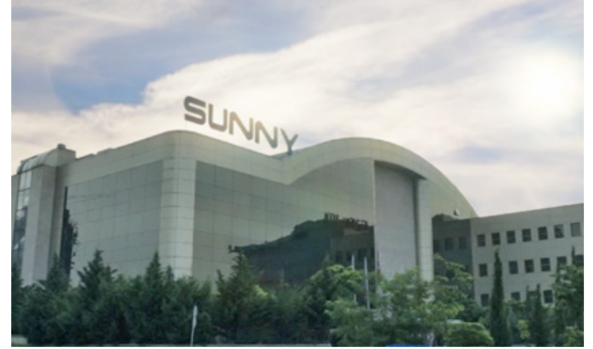
Atmaca Şirketler Grubu, SUNNY markası ile elektronik ve ev aletleri sektöründe geniş bir ürün yelpazesine sahip ve bin 500'den fazla çalışını ile istihdama katkıda bulunuyor.