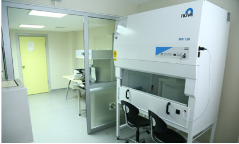
Nisan 2013'te Cerrahpaşa Hastanesi Kemik İliği Nakil Ünitesi devreye girdi. Beş yılda 276 kişiye yeniden can veren ünite, yüzde 95 oranında başarılı operasyonlarla Türkiye'nin gözdesi.