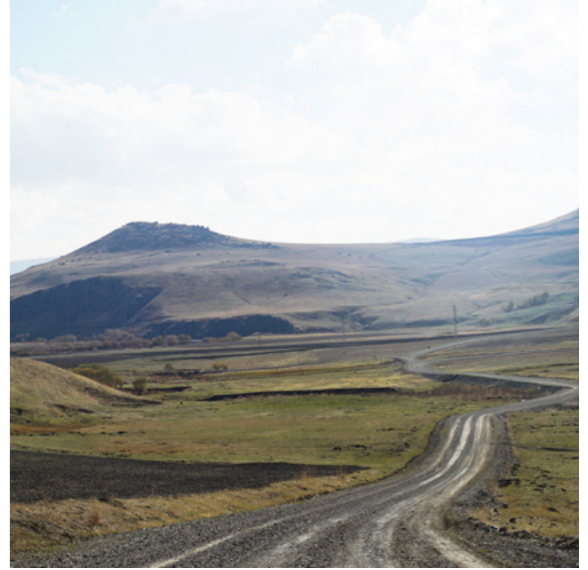
Atmaca ailesinin, uzun yıllar yaşadığı Kamışlı Köyü'nden geriye sadece çorak bir arazi ve duvarları yıkılmış evlerin direkleri kaldı.

1960'ların başı, Ağrı şehir merkezine 16 kilometre uzaklıktaki