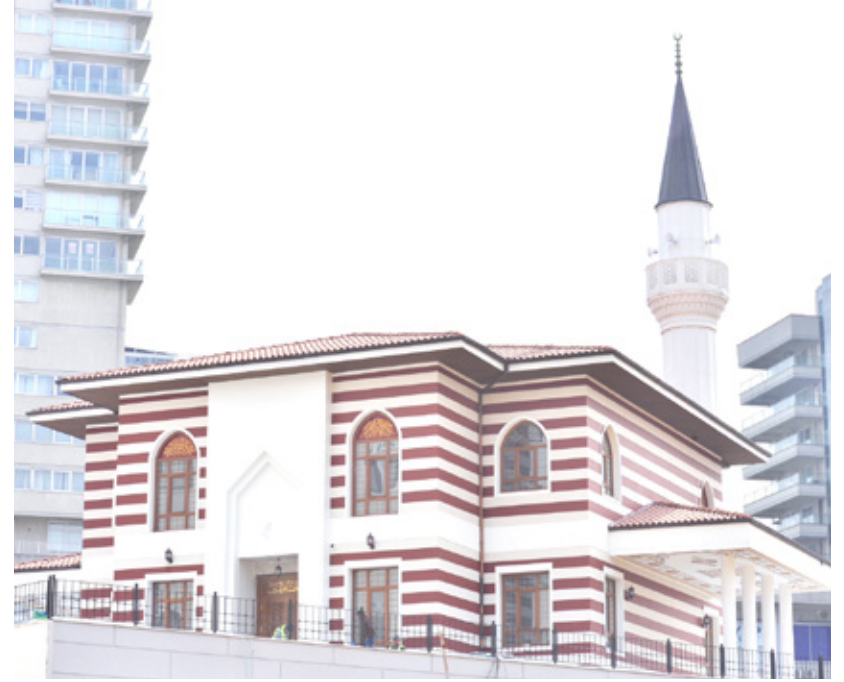
İstanbul Başakşehir'de yapılan Hayrettin Atmaca Camii.