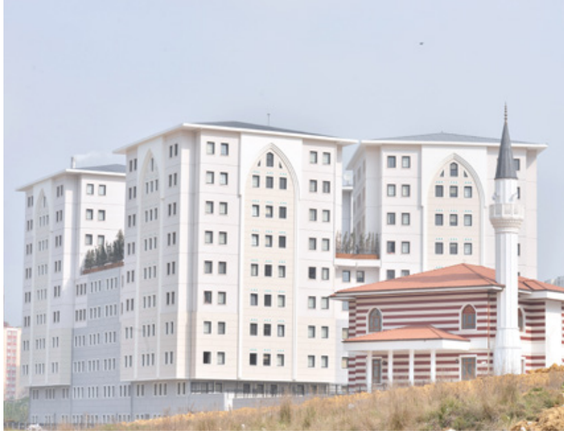
İstanbul Başakşehir'de yapılan 800 öğrenci kapasiteli Katibe Atmaca Kız Öğrenci Yurdu.